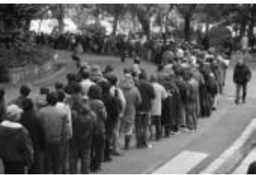
非正規労働者、派遣労働者の声を国会に届けよう！