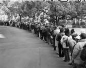
2008-9年越し派遣村の悲劇を繰り返してはいけません。